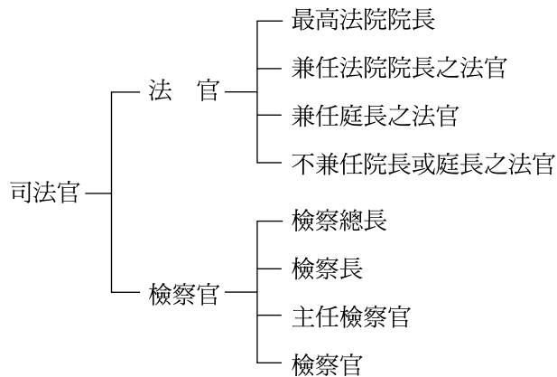
圖一 司法官類別表

各國均有司法官之設置，但因文化背景或教育方式不同，所呈現的資訊行為模式也會有所差異。此外，本研究場域為研究者之一所服務之「法務部司法官訓練所圖書室」，所服務讀者包括司法院暨所屬機關