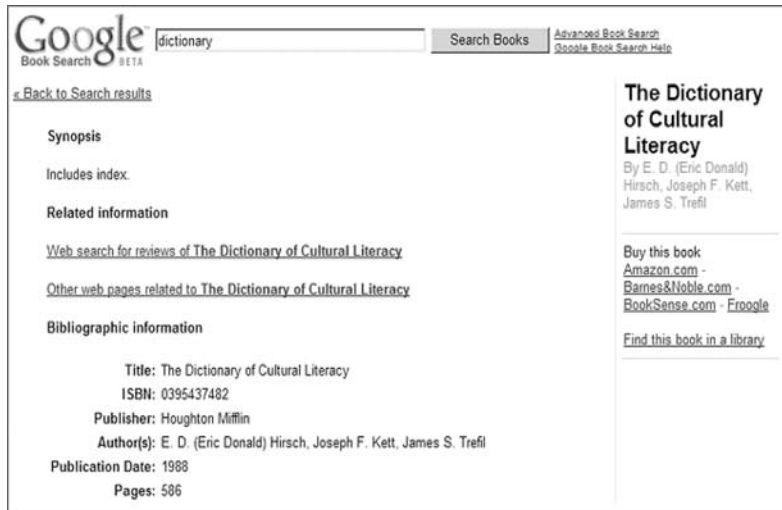
圖四 Google Books Search之No Preview Available顯示