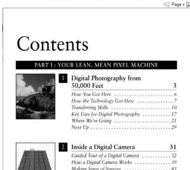
圖二 Google Book Search之Limited View

Mastering Digital Photography: The Photographer's Guide to Professional-Quality Digital Photogra by David D Busch - Sample pages from the Google Books Partner Program